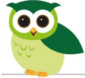
juf Marishka Gym