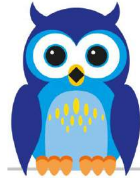
juf Gerry Intern Begeleider